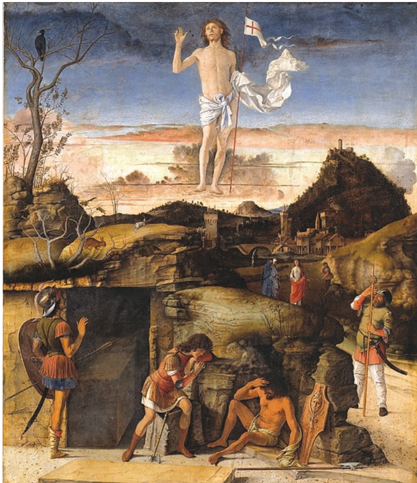
Opstanding. Giovanni Bellini 1479