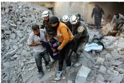
De Witte Helmen