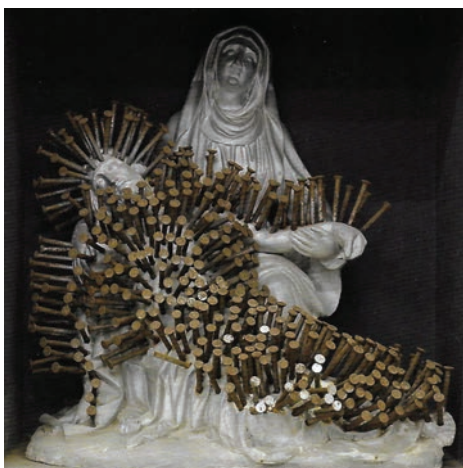
Jacques Frenken, Spijkerpiëta (ca 1968)

Onder deze titel presenteerde Het Noordbrabants Museum in 's Hertogenbosch dit voorjaar een intrigerende tentoonstelling over het hergebruik van heiligenbeelden in de Nederlandse beeldhouwkunst. De gipsen heiligenbeelden die zo lang de kerken en de woningen van de Nederlandse rooms-katholieken hebben gesierd, maar in de afgelopen vijftig jaar in onbruik zijn geraakt en massaal zijn weggedaan, worden vanaf de jaren zestig door kunstenaars naar hun atelier gebracht en onder handen genomen. Wat doen ze er mee? Is het blasfemie of beeldhouwkunst, ramkoers of redding, ergernis of erbetoon?