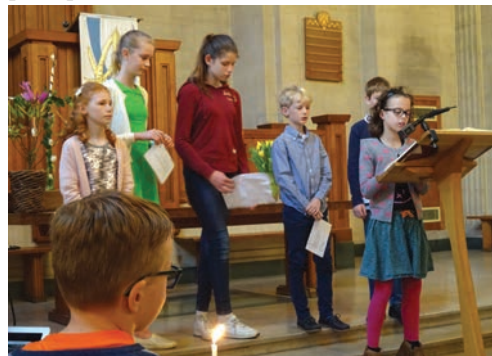
Paasviering met de kinderkerk

Sinds het laatste kerknieuws hebben we de paastijd weer achter de rug en dus Palmzondag en Pasen gevierd. Bij de palmpaasviering hebben we mooie palmpasestokken versierd en de betekenis achter de