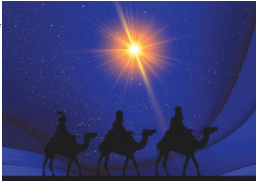
Drie wijzen zien het licht

Het kerstverhaal laat zien dat je altijd het onverwachte mag verwachten.