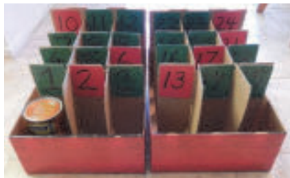
Doe mee vanaf 1 december

Het is de eerste zondag van advent op 3 december dit jaar. Veel mensen en vooral kinderen vinden het leuk om een adventskalender met chocola of cadeautjes te krijgen en zo de dagen tot kerst af te tellen. De diaconie wil u vragen om dit jaar ook een omgekeerde adventskalender te