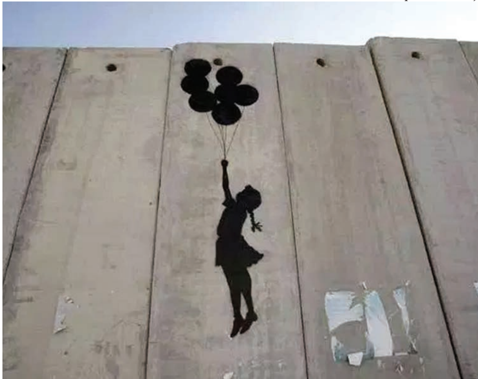
Afbeelding: 'flying balloon girl' door Banksy, inzending van Juliette Bogaers voor de digitale 40-dagen kalender