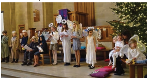
Kerstspel in de Nederlandse Kerk