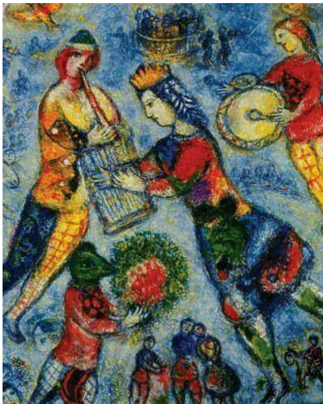
De muziek door Marc Chagall