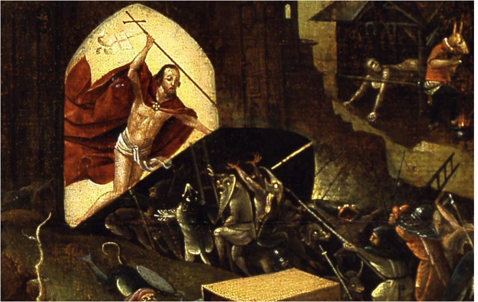
Christus in het voorgeborchte( detail;navolger Jeroen Bosch, ca. 1550)