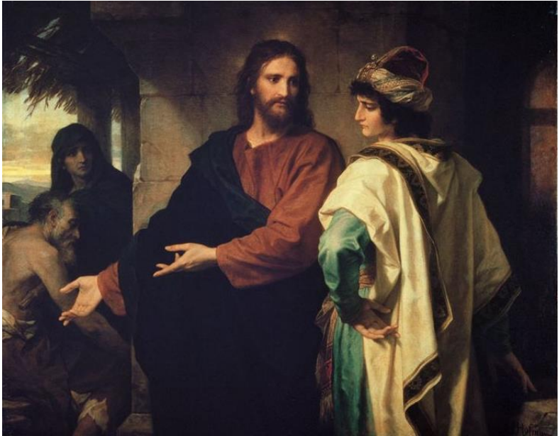
Jezus en de rijke jongeling door Heinrich Hoffmann