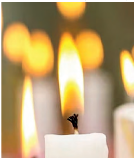
Licht dat doorbreekt in het duister

Ja, zo voelt het voor mij. Ik heb weinig behoefte aan vrolijke of zoete kerstliederen over vrede op aarde, midden in de winternacht. Maar moeten we dan maar niet meer zingen? Of vraagt die donkere tijd juist om een lied? Een lied tegen het donker. Niet een zoetsappig kerstlied over een kirrende baby die zijn hoofdje te rusten legt in een kribje vol stro, maar een bescheiden lied van verlangen.