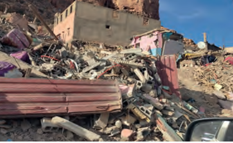
Marokko's verwoestende aardbeving

In een tijd die wordt gekenmerkt door verdeeldheid, zoeken we dit jaar als diaconie met onze december-