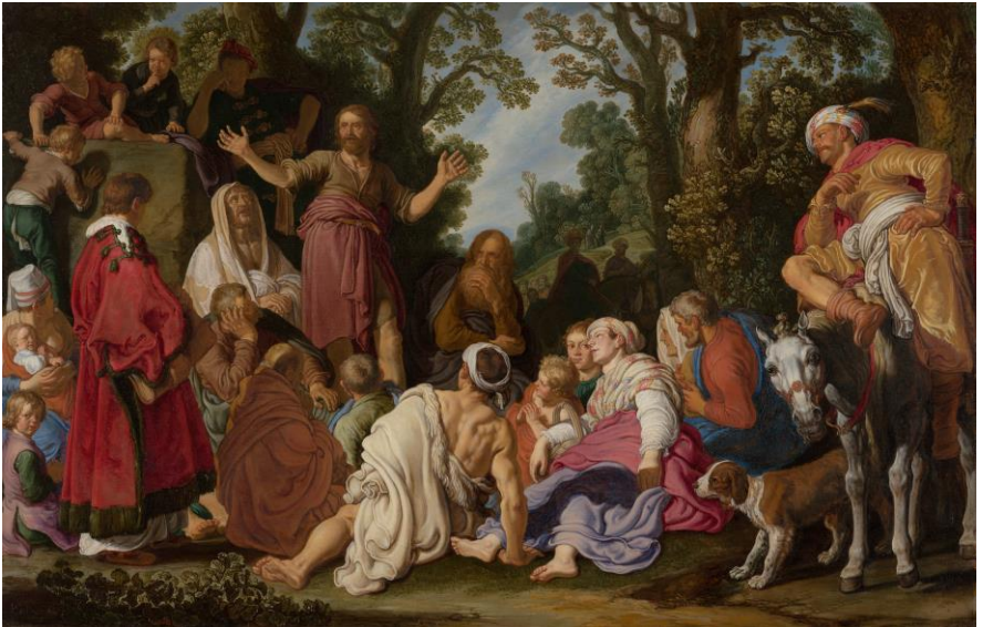
De prediking van Johannes de Doper, by Pieter Lastman