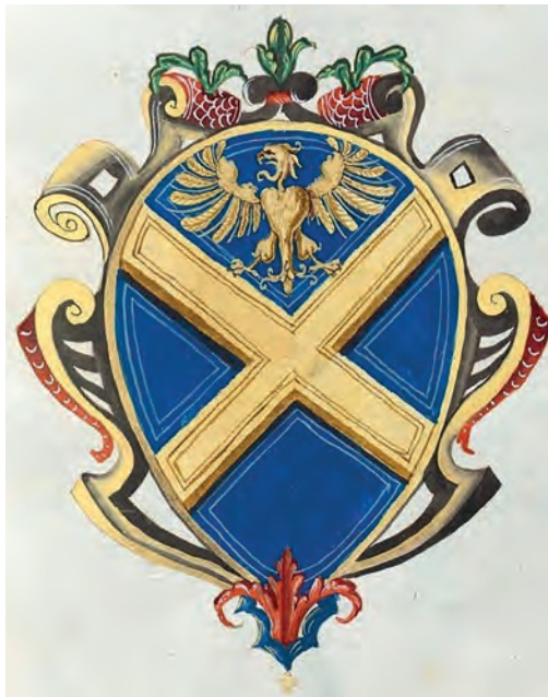
Het Calandrini familiewapen

Het is een geweldig verhaal; Calandrini die met zijn indrukwekkende netwerk en zijn connecties tijdens zijn predikantschap van onschatbare waarde blijkt voor de Nederlandse