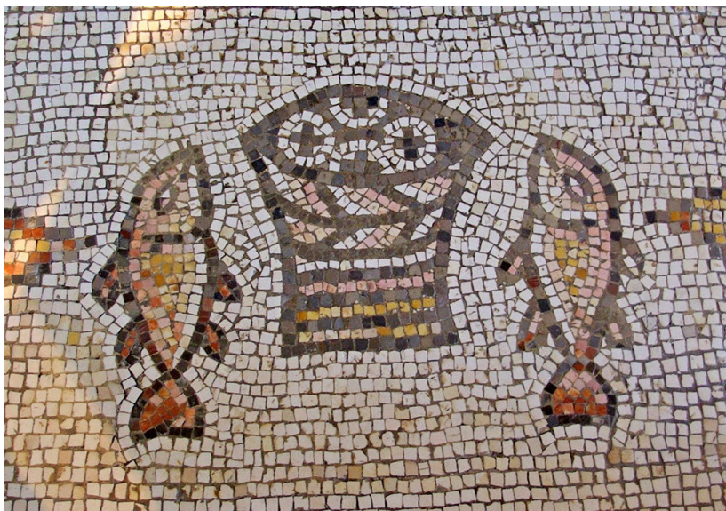
5 e eeuwse kerkmozaïek, Kafarnaïm